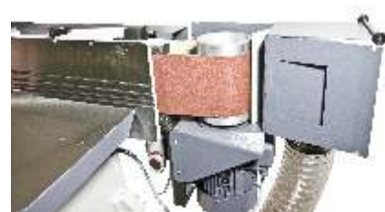
problemloses Öffnen der Absaughaube