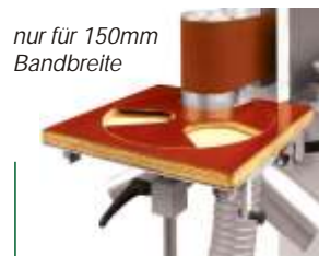
nur für 150mm Bandbreite

Holzprofi Pichlmann GmbH * Watzing 2 * A-4661 Roitham Tel.: +43 (0) 76135600 * pichlmann@holzprofi.com