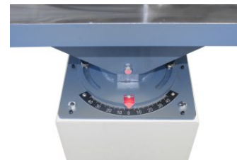
drehbarer Tisch optional